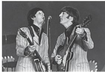
1966年の英ロックバンド「ビートルズ」の来日公演でジョン・レノンさん（右）とポール・マッカートニーさんを写した1コマ の棚でネガフィルム19本が見つかり、今年が来日公演60周年に当たるため、ビートルズ研究家の大村亨さんに鑑定を依頼した。