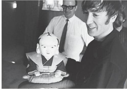
福助人形を手にほほ笑む英ロックバンド「ビートルズ」のジョン・レノンさん。1966年の来日公演で撮影された写真102枚分のネガフィルムが見つかった

で、日本武道館が音楽の殿堂として親しまれるきっかけにもなった。同館によると、2009年に事務所内