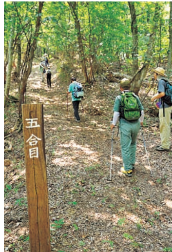
林道は急な坂もあるが、日陰が続き、土壌はやわらかく足に優しい。自分のペースで無理せずゆっくり。高度を伝える手づくりの登山標柱が元気をくれる。