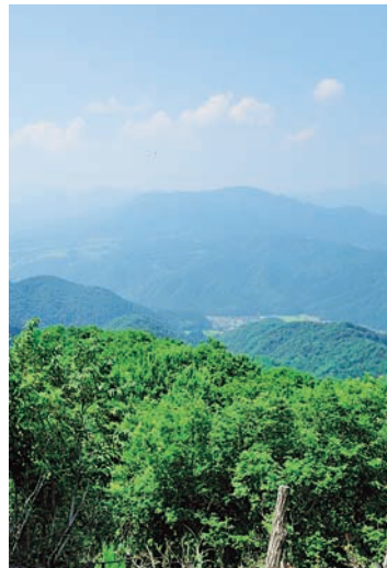
「馬の背」からの絶景(右下)に疲れを癒やされ、山頂が目に見えてたちまち元気に。ウッドデッキの展望台が近づくと、「早くあそこへ」と心がはやる。