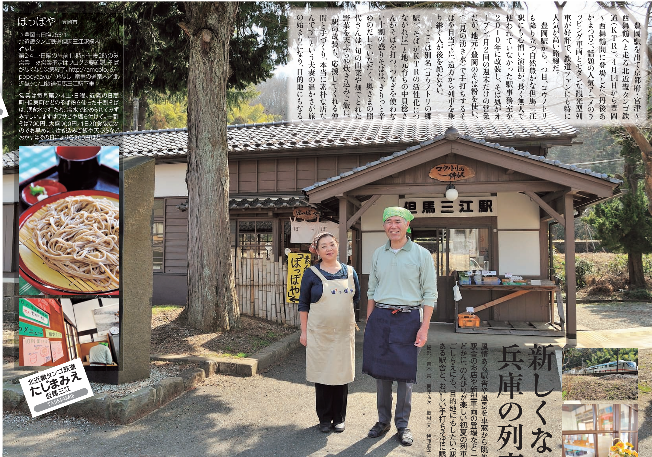
取材文/伊藤順子 新谷慶子 牧野しのぶ

ぽっぽや | 豊岡市 ▶ 豊岡市日撫265-1 北近畿タンゴ鉄道但馬三江駅構内 〆なし 第2・4土・日曜の午前11時〜午後2時のみ営業 ※営業予定はブログで要確認。そばがなくなり次第終了。http://ameblo.jp/popyayaui/ 〆なし 電車の道案内/北近畿タンゴ鉄道但馬三江駅下車