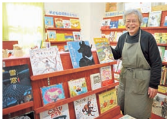
「全国でも絵本専門店は山の上やのどかな場所に多いから」と垂水から通う。本を買ってカードを集めると手相や四柱推命占いも!