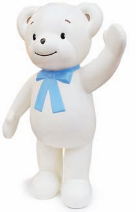
キャラクターの〈ファミちゃん〉と〈リアちゃん〉は双子の兄妹。あいに来て!

自然の中で遊んだり、思い出に残るお店やレストランへ。 子どもや孫と一緒に楽しみたい春のお出かけ先のあれこれ。 大人も満喫、思わず子どもに返って駆け出したくなる遊び場をご紹介します!