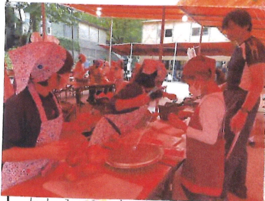
おいしいカレー作り

すごく、楽しく ほそけんさん てんがさきも ばがおどって ちよかつて ておもしろか す。 たです。