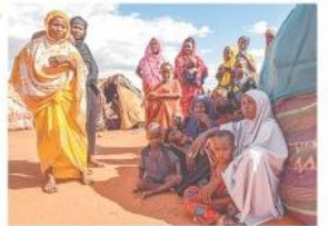
ひどい日照りが続き、こまっているソマリアの人々=5月

背景には、いままです。世界の達成率は、おそいながらも少しずつ増えています。20、21年は2年続けてやや減ってしまいました。