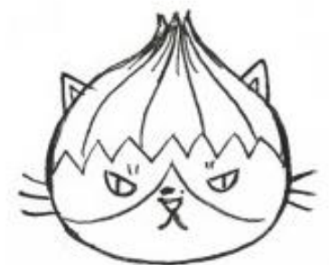
五国スタンプ淡路