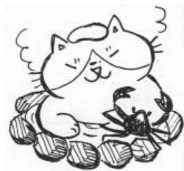
五国スタンプ但馬