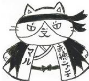
五国スタンプ播磨