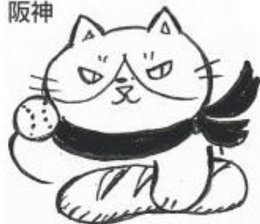
五国スタンプ神戸・阪神

「かなしきデブ猫ちゃん マルのはじまりの鐘」は神戸新聞で昨年4月から全36回連載され、4月14日に絵本が発売される。予約購入者にオリジナルしおりなどをプレゼントする先行予約キャンペーン中。申し込みはQRコードから。