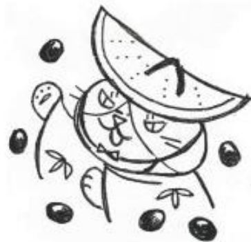
五国スタンプ丹波