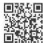
絵本予約のQRコード