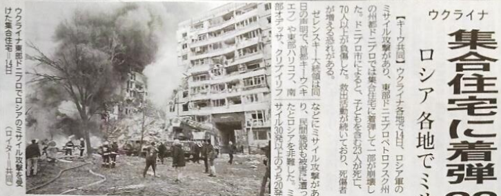
ウクライナ 集合住宅に着弾23人死亡