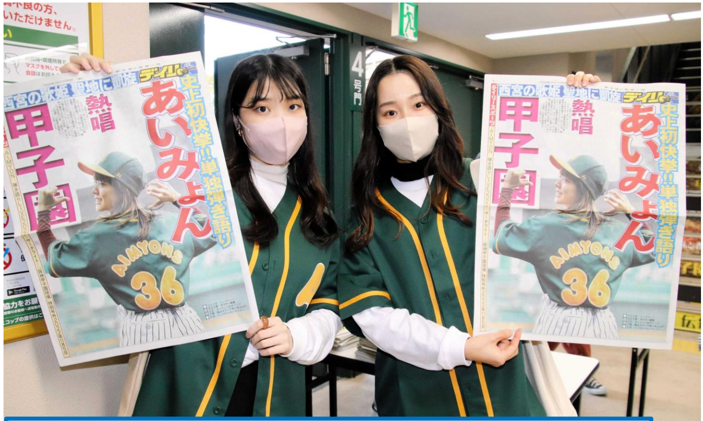
あいみよんの「里帰りライブ」を前に、デイリースポーツ社が発行した「あいみよん」特別号外を手にするファン＝2022年11月5日、西宮市、阪神甲子園球場