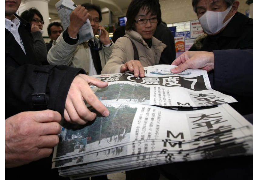
東日本大震災の被害を伝える神戸新聞号外を受け取る人たち＝2011年3月11日、神戸市中央区、JR三ノ宮駅前