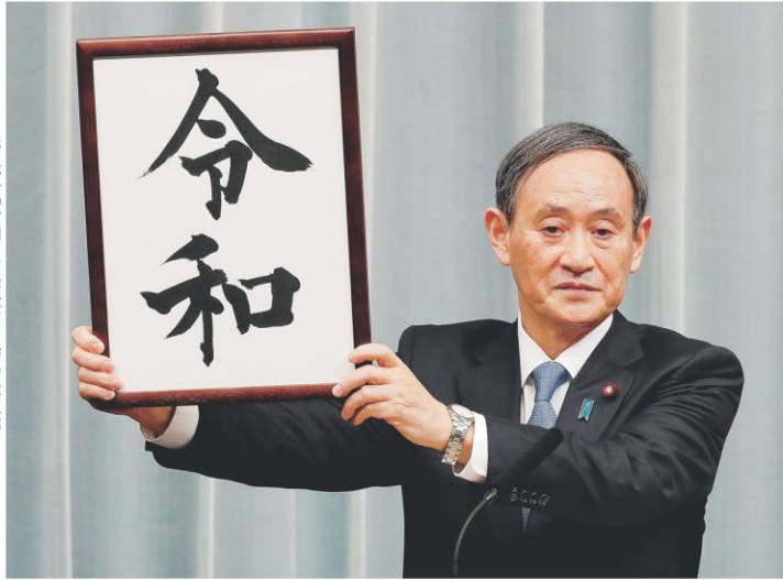
新元号「令和」を発表する菅官房長官 1日午前11時41分、首相官邸

1日には有識者9人による「元号に関する懇談会」を首相官邸で開いて意見を聞き、衆参両院の正副議長の見解も聴取して改元政令を閣議決定した。