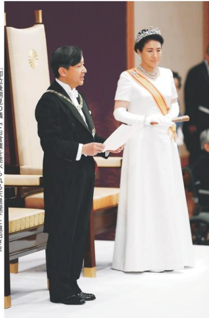
「即位後朝見の儀でお言葉を述べられる天皇陛下と皇后さま」 1日午前11時14分、宮殿・松の間

天皇陛下は1日、皇后さまと共に皇居・宮殿「松の間」で、国事行為の「即位後朝見の儀」に臨み、「憲法にのっとり、日本国および日本国民統合の象徴としての責務を果たすこと」を誓い、天皇后さまと皇太子さまのお言葉を述べられた。