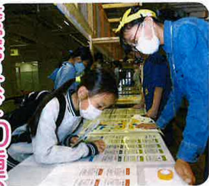
「ハローワーク」で仕事を選んで…

神戸を中心とした小学3年生〜中学3年生約300人が、飲食店員や警察官、デザイナー、図書館司書、ラジオDJなど約30種類の仕事を担当し、専用通貨「キート」で給料をもらって、やはり子どもが営む店で買い物や飲食を楽しんだ。