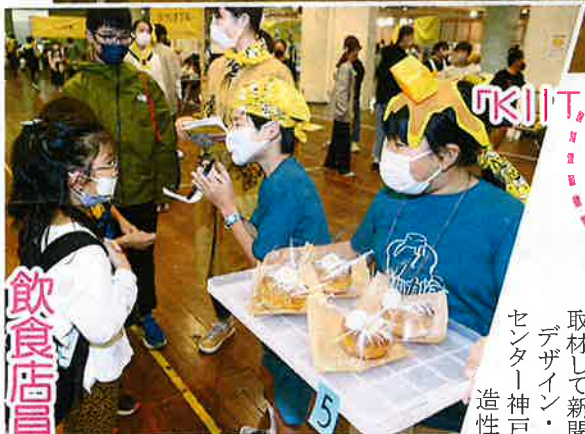
ドーナツなどの飲食店は10店舗

子どもだけが入れられる夢のまち「ちびっこうべ2022」が10月9日、神戸市中央区小野浜町のデザイン・クリエイティブセンター神戸（KIITO）にオープンした。