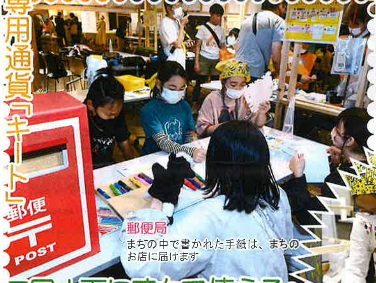
郵便局 まちの中で書かれた手紙は、まちのお店に届けます