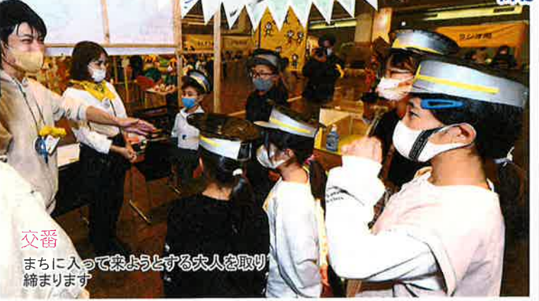
交番 まちに入って来ようとする大人を取り締まります