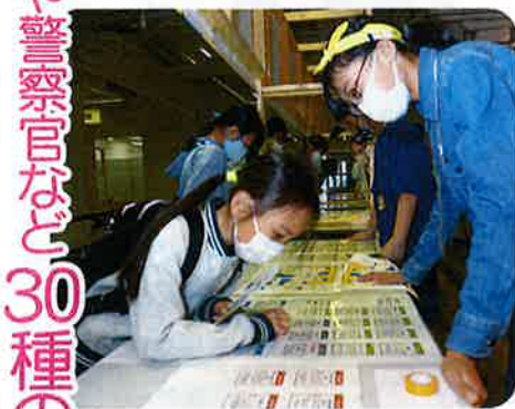
「ハローワーク」で仕事を選んで…