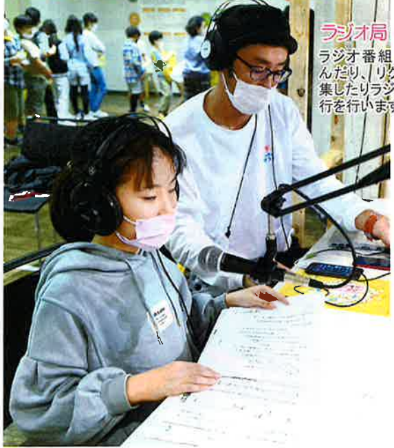
ラジオ局 ラジオ番組で原稿を読んだり、リクエストを募集したりラジオ番組の進行を行います