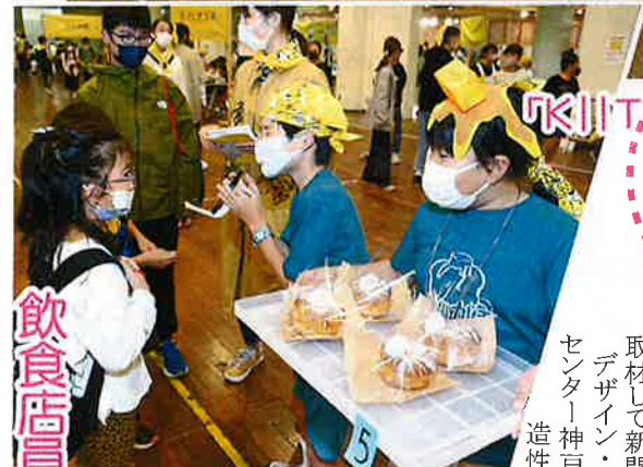
ドーナツなどの飲食店は10店舗