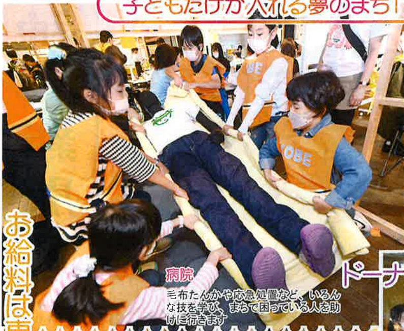
病院 毛布たんかや応急処置など、いろんな技を学び、まちで困っている人を助けに行きます