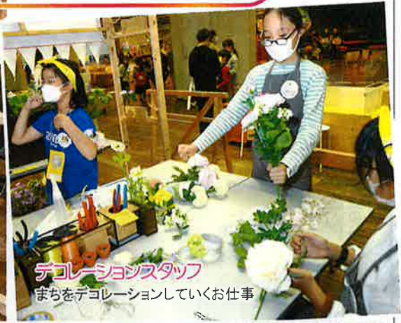
デコレーションスタッフ まちをデコレーションしていくお仕事