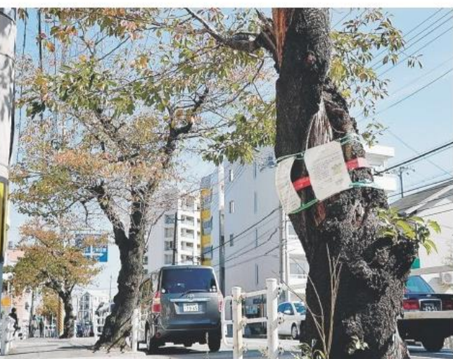
伐採が決まった桜の木。「小4男子」に対し、神戸市東部建設事務所からの返事2通が張られている＝いずれも神戸市灘区篠原北町1