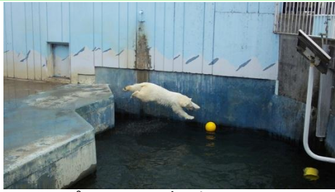
プールに飛び込むミルク