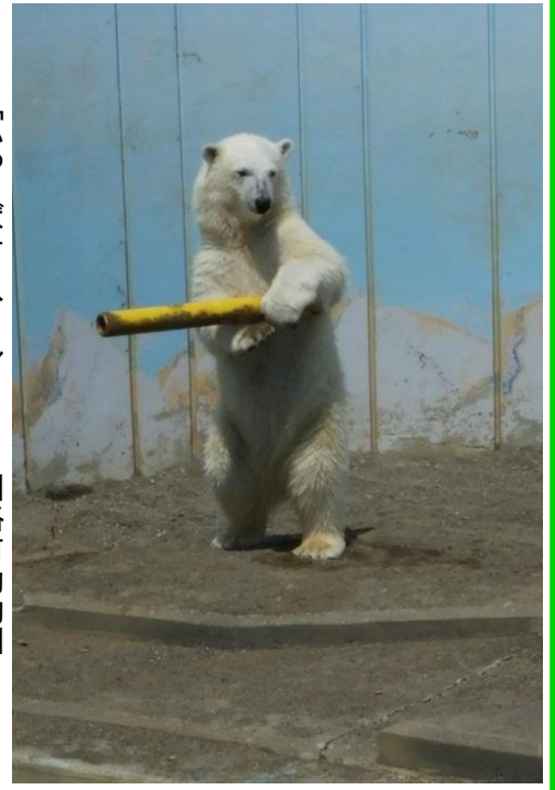
「かっとばせろ、ミルク!!」釧路市動物園